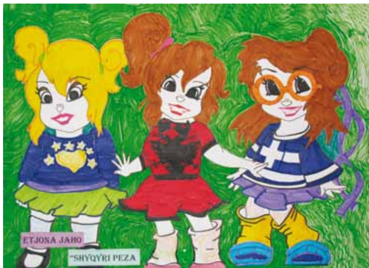
ETJONA JAHO (SHKOLLA SHYQYRI PEZA)

Unë kam paraqitur diskriminim etnik. Mesazhi im është: “Harta ka ndarje, vija, kufij, por njerëzimi duhet të jetë një. Për fëmijët në veçanti nuk duhet të ketë kufij në mendimet e tyre. Globi është një, bota është një, fëmijët e botës janë një”.