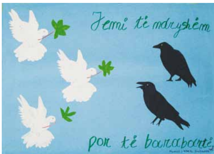
KLEA ZAHARIA (SHKOLLA BAJRAM CURRI)

Unë kam paraqitur diskriminim etnik. Mesazhi im është: “Harta ka ndarje, vija, kufij, por njerëzimi duhet të jetë një. Për fëmijët në veçanti nuk duhet të ketë kufij në mendimet e tyre. Globi është një, bota është një, fëmijët e botës janë një”.