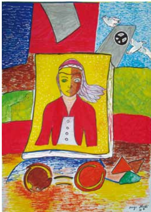
MEGI NUSHI (SHKOLLA BAJRAM CURRI)

Në pikturën time kam dashur të ndërthur shumë simbole, ku mbi të gjitha doja të transmetoja mesazhin: “Ne jemi të barabartë dhe diskriminimi nuk duhet të ekzistojë mes nesh”.